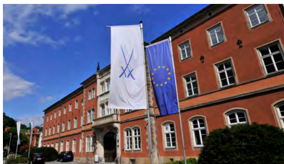
Seit ihrer Gründung 1710 befindet sich die Porzellanmanufaktur in Meißen.

Jahr und wir freuen uns auf eine weiterhin vertrauensvolle und produktive Zusammenarbeit.