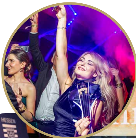
Musik-Mix de Luxe in der GIBSON Club-Lounge , der Hessen-Lounge und im Großen Saal mit Rock-Ikone Gianna Nannini .