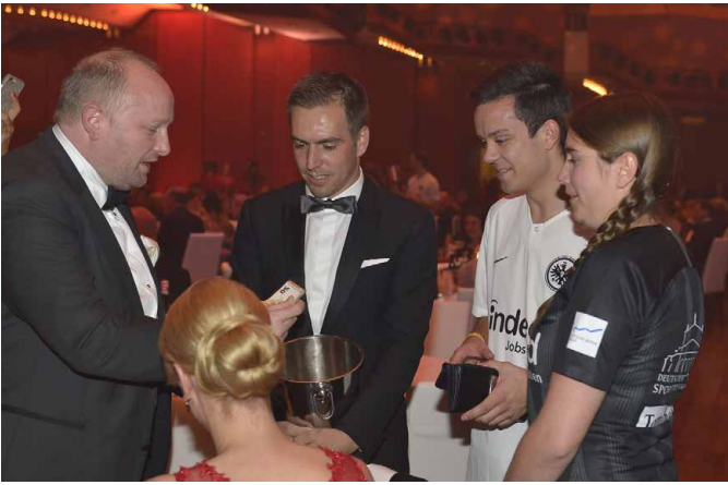
Unterstützung des Tombola-Losverkaufs durch prominente Paten (beispielsweise Philipp Lahm, Bildmitte)